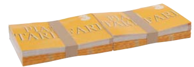
Zweifachnutzen / two-up

Die US-2000 TRS Banderoliermaschine übernimmt die Produktstapel vom Förderband (Einzel- oder Doppelnutzen) und transportiert sie an den Produktheanschlag. Vor dem Banderolieren werden die Stapel an allen vier Seiten ausgerichtet.