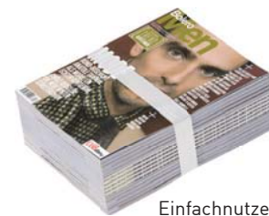
Einfachnutzen / one-up