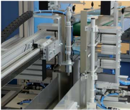
Die Produkte werden mit Zwischenstapler gestapelt. The products get stacked with intermediate stacker.