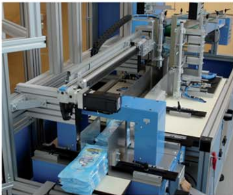
Der Stapel wird durch den nachfolgenden aus der Maschine geschoben. Product will be pushed out of the machine by the following stack.