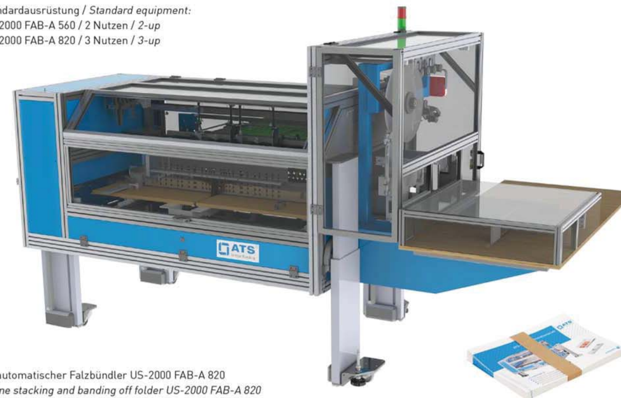
Vollautomatischer Falzbündler US-2000 FAB-A 820 In-line stacking and banding off folder US-2000 FAB-A 820

Standardausrüstung / Standard equipment: US-2000 FAB-A 560 / 2 Nutzen / 2-up US-2000 FAB-A 820 / 3 Nutzen / 3-up