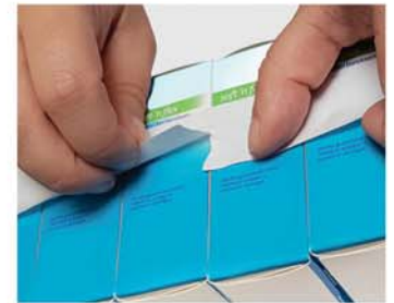
Einfaches Öffnen Easy opening